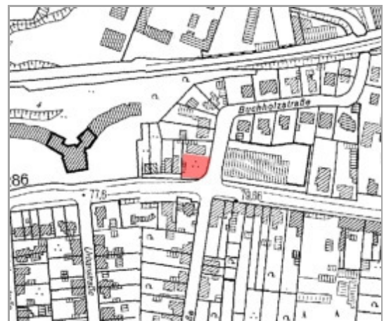
DGK 5 © Rheinisch-Bergischer Kreis: Vermessungs- und Katasteramt