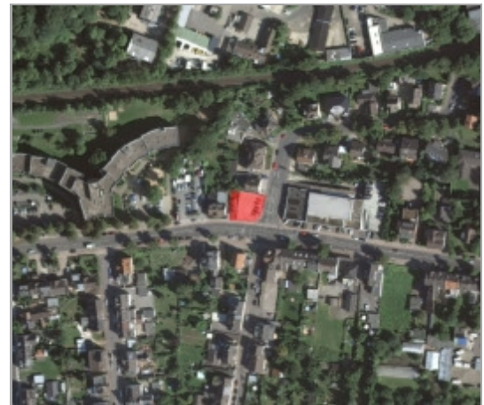
Luftbild Bergisch Gladbach