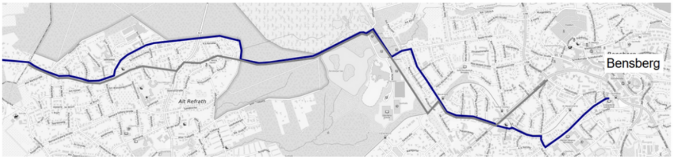
Routenführung der Zubringerroute. Zubringerroute Stand 2024 (dunkelblau) und ursprl. Routenführung aus der Machbarkeitsstudie (grau)

Für den Abschnitt der Golfplatzstraße wurden aufgrund seines hohen Planungsaufwandes zudem durch ein Ingenieurbüro drei mögliche Ausbauvarianten erarbeitet .