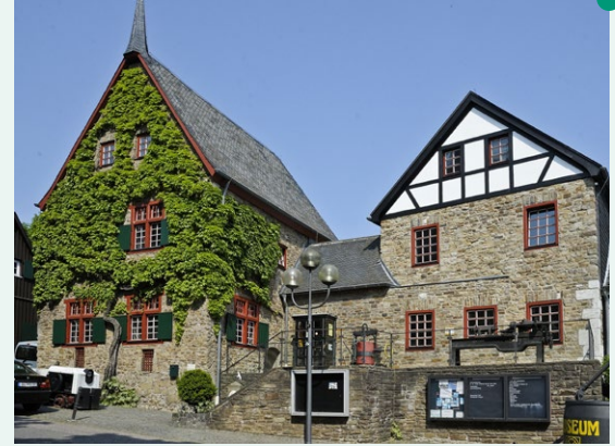
Museum van mijnbouw, ambacht en handel, Bensberg

Goethe bezocht de kasteelstad in 1774 en schreef in "Dichtung und Wahrheit", Boek 14: "... indrukwekkender vind ik een uitstapje naar het jachtslot Bensberg, dat op de rechteroever van de Rijn ligt en van het prachtigste uitzicht geniet ...".