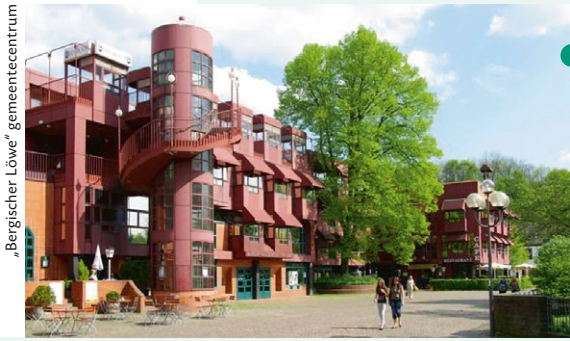
„Bergischer Löwe“ gemeentecentrum