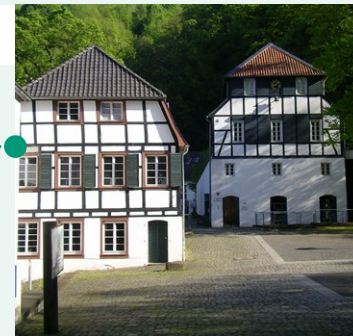
Vakwerkhuzen van de papiermolen „Alte Dombach“

Als je “Gladbach” zegt, vergeet dan niet “Bergisch”. Bergisch dat betekent ook bijzondere architectuur. Vakwerkhuzen met zwarte balken, witte vakken, groene luiken en zwarte leien daken zijn typisch voor de regio. Er zijn er nog een paar te bewonderen in Bergisch Gladbach – vooral in de landelijke buitenwijken van de stad. Een ontdekkingstocht is de moeite waard!