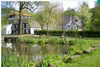
Papiermolen „Alte Dombach“