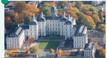
Grandhotel Schloss Bensberg

De prins maakte de voltooiing niet meer mee; kasteel Bensberg heeft nooit als residentie gediend. De geschiedenis van het kasteel was daarna zeer gevarieerd: het barokke gebouw werd gebruikt als militair hospitaal, cadet- en opleidingscentrum, en recentelijk als Belgisch gymnasium en als onderkomen voor vluchtelingen uit de Balkanoorlog. In augustus 2000 opende het Grandhotel Schloss Bensberg 14 in het barokke paleis na uitgebreide renovaties.