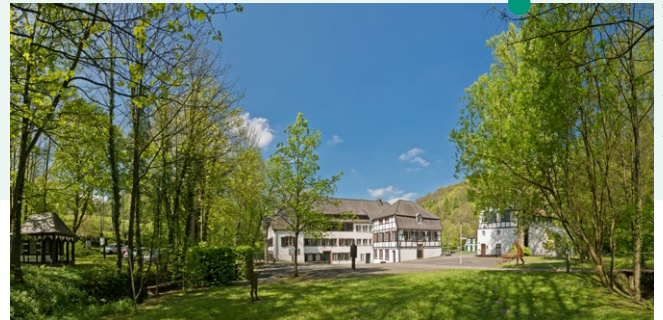
Papiermolen „Alte Dombach“

Permanente en speciale tentoonstellingen over het papiergeschiedenis, educatieve evenementen en lezingen over het papiergeschiedenis en lokale geschiedenis maken het programma compleet.