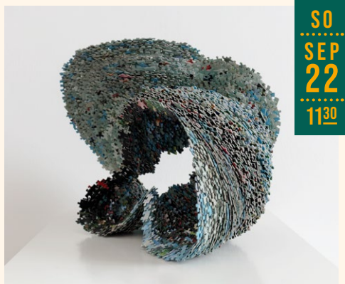
Tina Haase, Stratigraphie, 2010, aus der Sammlung „Kunst aus Papier“, Kunstmuseum Villa Zanders

In Kooperation mit dem Bürgerverein Rommerscheid.