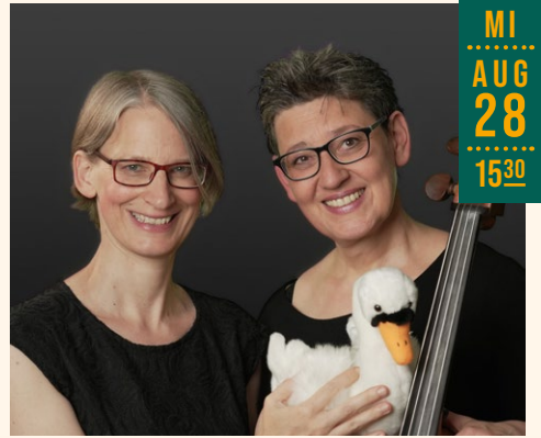
© Elisabeth Wand und Lioba Bärthlein