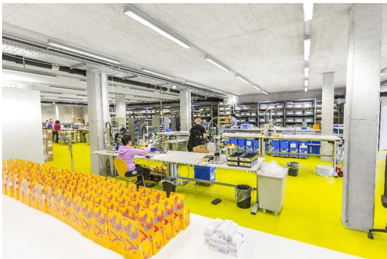
Produktion von Reagenzien