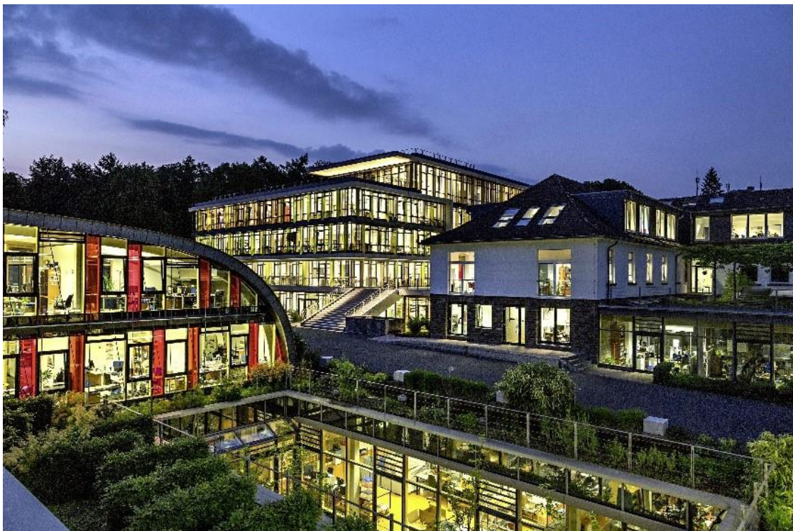
Der Campus von Miltenyi Biotec